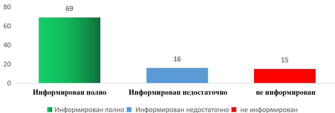
Насколько полно Вы информированы о содержании обновленных ФГОС в целом? %

Проанализировав ответы родителей по вопросам внедрения и реализации ФГОС ОУ было выявлено, что большинство родителей (65%)