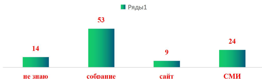
Из каких источников Вы узнали о введении в школу обновленного образовательного стандарта (ФГОС)? (%)

Изучив опросы родителей, приятно отметить, что больше половины родителей (62%) информирована по вопросам внедрения и реализации обновленных ФГОС от педагогов на родительском собрании или сайта школы. Для другой части родителей (24%) источниками служат другие средства информации. Но есть и такие родители (14%), которые впервые слышат об этом.